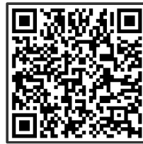
Dialog online üben