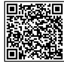
Alle Lernmaterialien zu diesem Thema

Lösungen: Good morning. David Brown speaking. / Good morning. This is Emma Wood. I would like to speak to Mr. Gray. / Just a second, I'll check if he is in already. / Thank you. / I am sorry, but Mr. Gray is not here yet. / Can you tell me when he will be in? / Probably around 4 pm. / Alright, I will call again later then. Thank you. / You're welcome. Goodbye. / Bye.